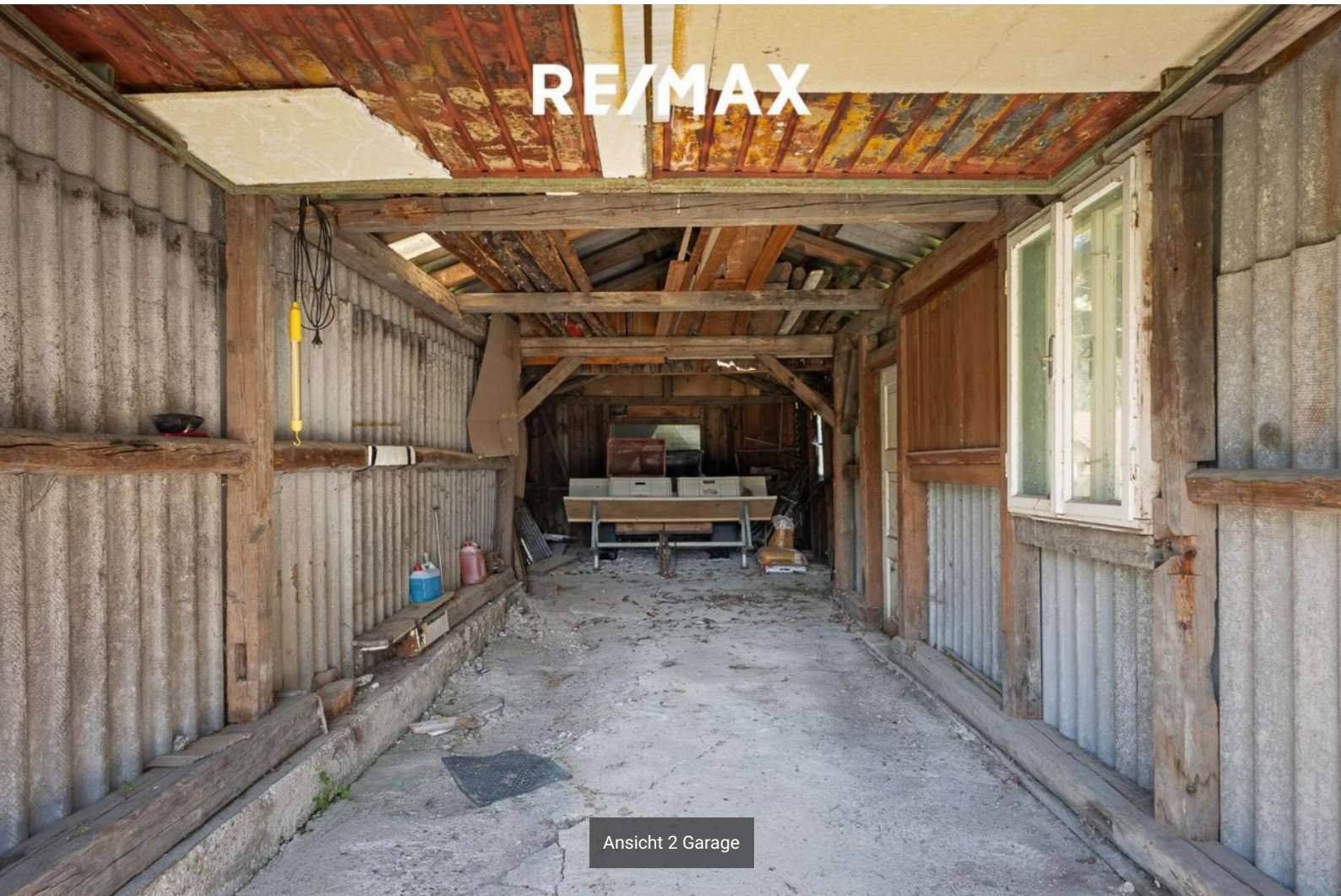
Ansicht 2 Garage