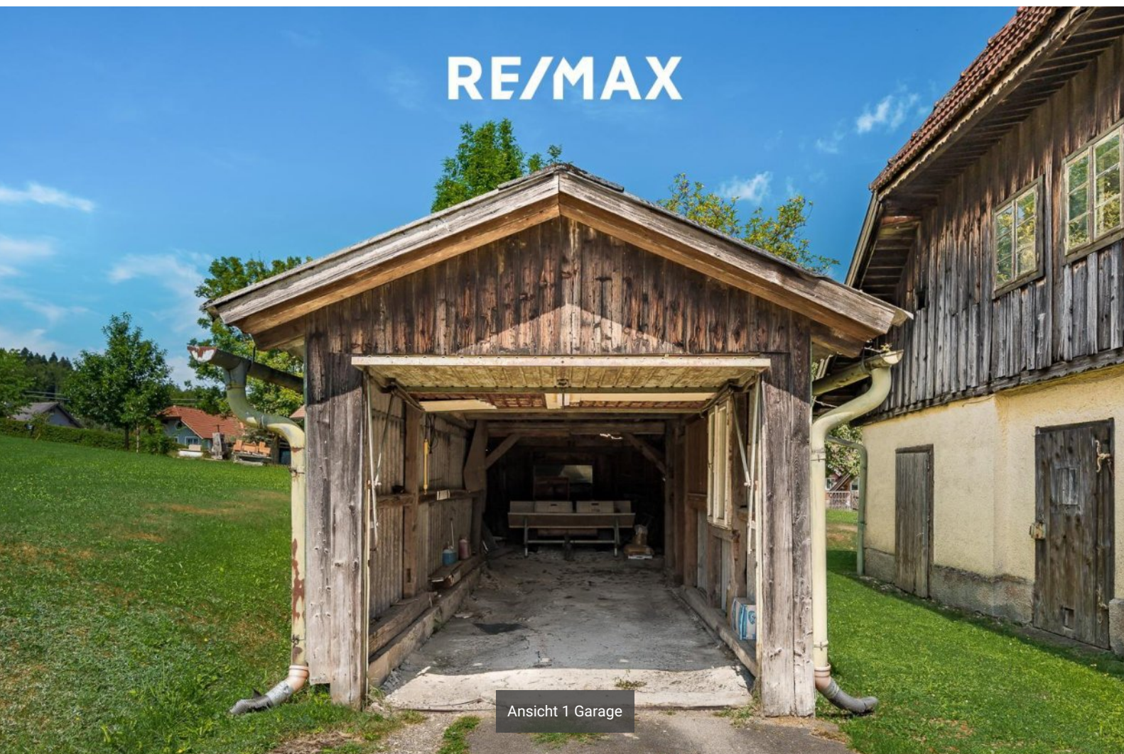
Ansicht 1 Garage