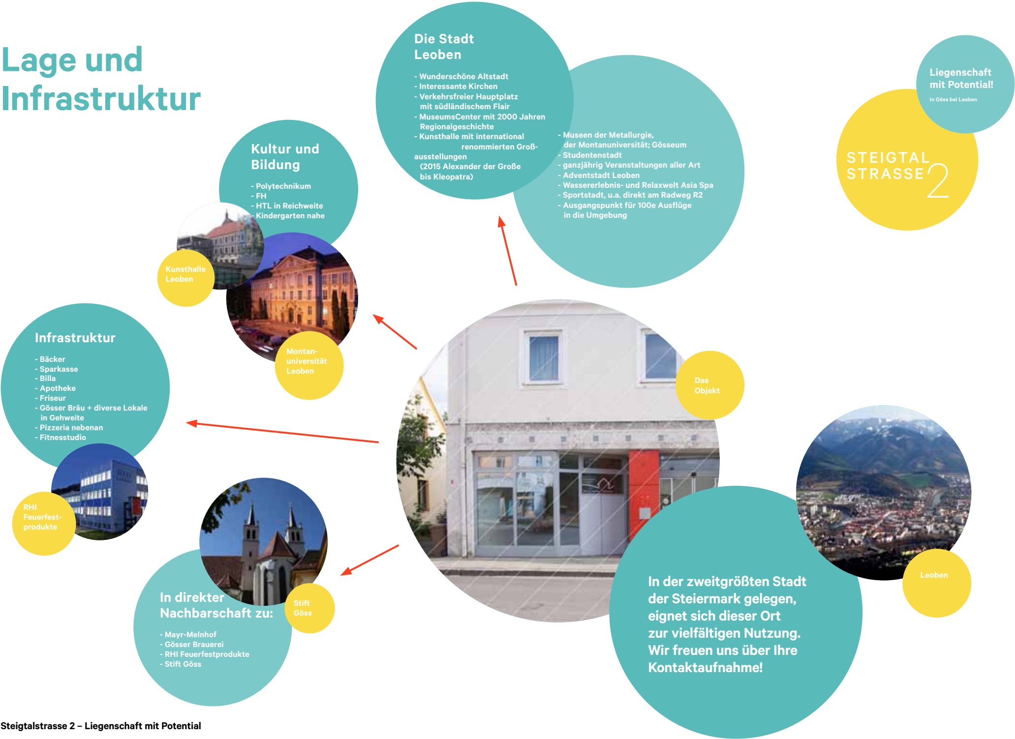
Steigtalstrasse 2 – Liegenschaft mit Potential